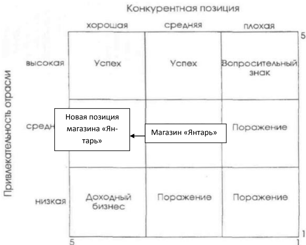
Рисунок 2 – Необходимое изменение положения магазина «Янтарь»

Не вызывает сомнений тот факт, что характеристики покупателя в разных районах города достаточно сильно различаются. В специальной литературе встречается достаточно трудов, посвящённых зонированию городской территории. Как отмечают Ж.Ж. Чимитдоржиев, С.Н. Казаченко, О.Я. Тен [17], применение зонирования территории города на географические сегменты и выявление в них точек роста необходимо для адекватного управления развитием потребительского рынка, в частности размещения предприятий. Л.Э. Лимонов в своей работе [8] отмечает ряд мировых тенденций в развитии городского ландшафта: рост городского населения, активное проникновение финансовых структур на рынки недвижимо-